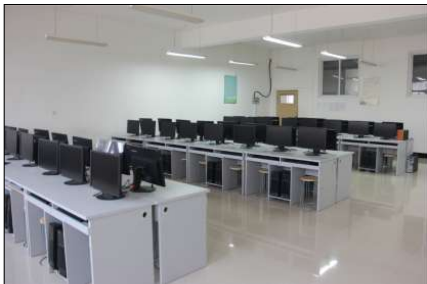
电子商务实操实训室

我院电子商务专业提供电子商务实操实训室、顺丰物流实训室、城院云商城、ERP 沙盘实训室 4 个实训室作为培训场地，其中顺丰物流实训室和城院云商城分别引入企业真实项目，由学生完成真实的电子商务项目服务，在全真职业环境中学习、实践并得到及时的提高与检验。